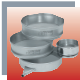
Tamis d'analyse et fond de tamisage