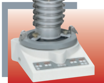
« analysette 3 » PRO pour tamisage de micro-précision