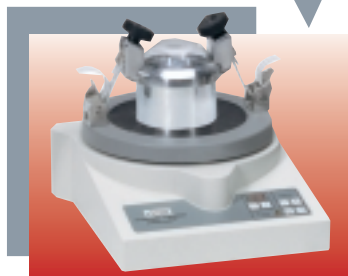
Microbroyeur à vibrations « pulverisette 0 »