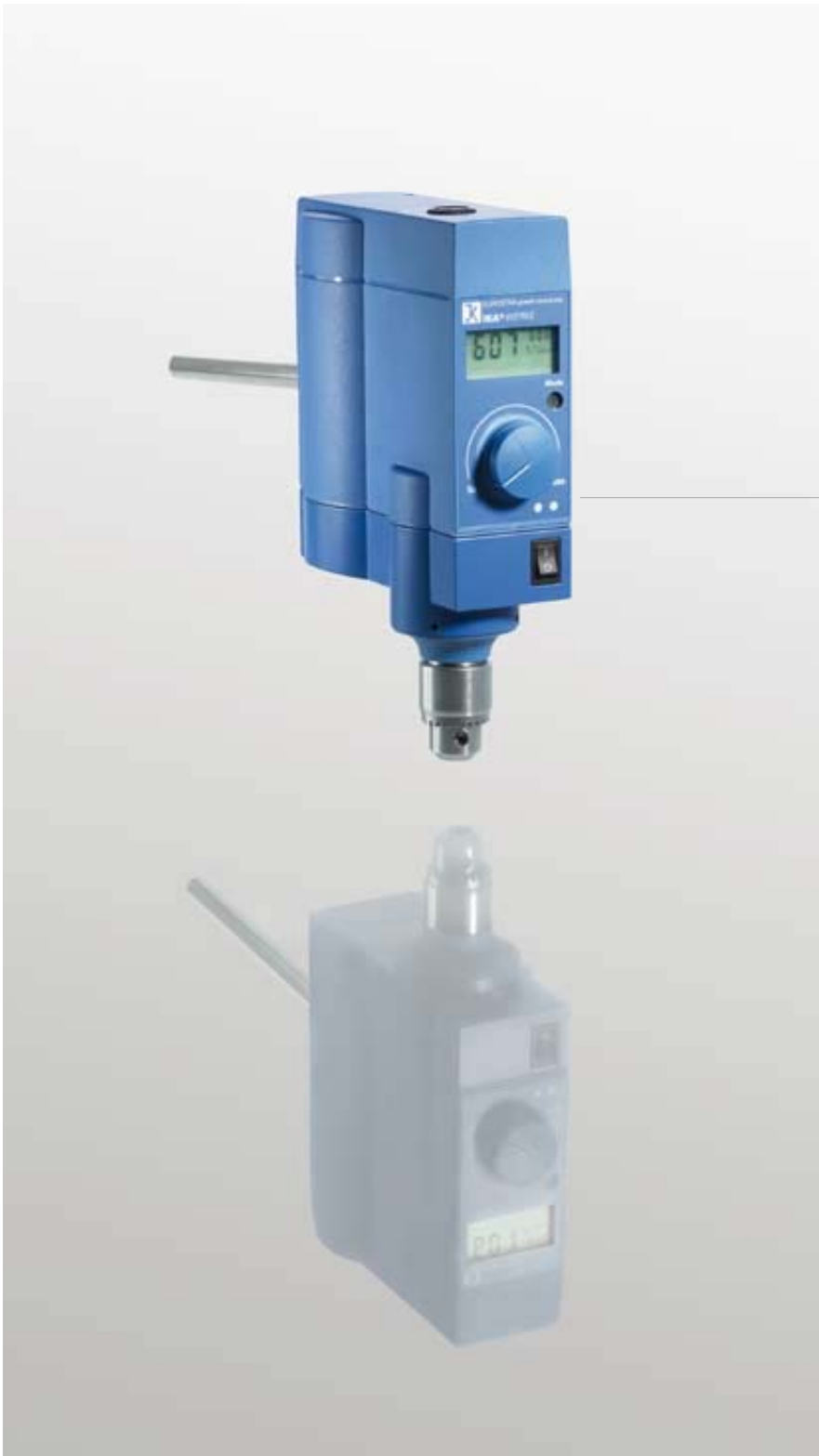
EUROSTAR power control-visc Agitateur à hélice digital à couple élevé